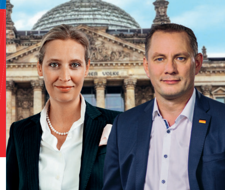
DR. ALICE WEIDEL & TINO CHRUPALLA BUNDESSPRECHER DER AFD