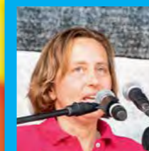
Beatrix von Storch:

„Die schwarzrote Regierung unter Frau Merkel verspielt gerade die Zukunft unserer Kinder, Kindeskinde und unseres Landes. Und immer noch schauen zu viele Bürger sehenden Auges zu und sind nicht bereit die Realitäten anzuerkennen. Um Deutschland aufzurütteln, gehen wir auf die Straße.“