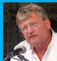
Prof. Dr. Jörg Meuthen:

„Ein Deutschland mit Zukunft braucht effektive Grenzkontrollen, abgelehnte oder straffällige Asylbewerber müssen mit einer nationalen Kraftanstrengung abgeschoben werden. Mit der Demonstration wollen wir einen Ruck unter den Deutschen auslösen, dass es so wie bisher nicht weitergehen kann. Wir wollen Deutschland in eine sichere Zukunft zu führen, in der unsere Kinder und Enkel in Frieden, Freiheit und Wohlstand leben können.“