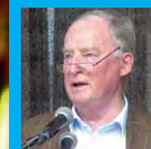
Dr. Alexander Gauland:

Die Reden finden Sie live auf afdkompakt.tv .