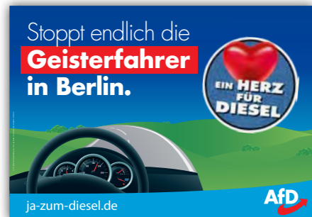
Plakate „Diesel-Kampagne“ mit verschiedenen Motiven

Mit dem übergreifenden Motto „Ja zum Diesel“ wurden in mehreren Bundesländern bereits AfD-Dieselskampagnen gestartet, die nun durch eine bundesweite Kommunikationsinitiative unterstützt werden: